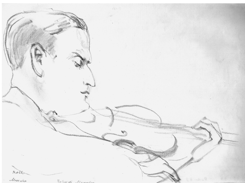
Yehudi Menuhin (1916-1999), violinista americano.

Uno dei nomi più famosi del concertismo internazionale, noto anche per aver esordito come enfant prodige ed aver eseguito a soli 11 anni, a New York, il Concerto per violino e orchestra di Beethoven