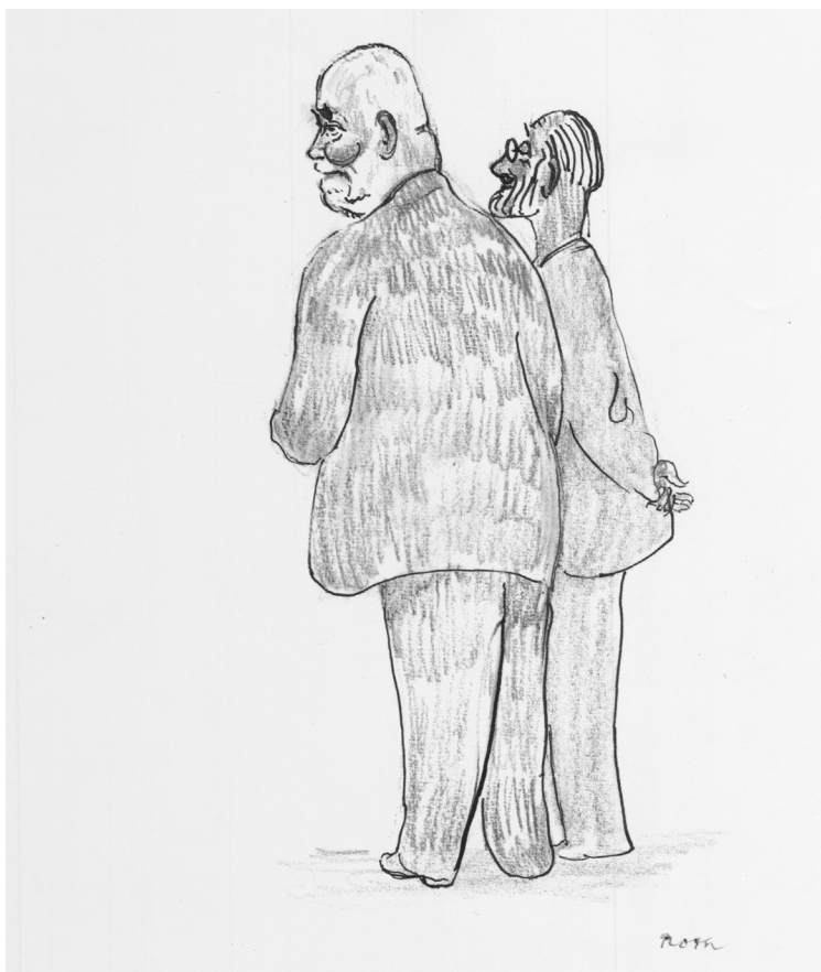
Alberto Giacometti (1901-1976), scultore e pittore svizzero, vissuto fra Ginevra, Roma e Parigi. Aderì dapprima al cubismo, nel 1929 al movimento surrealista. Nel 1962 ricevette il Gran premio della Biennale di Venezia e nel 1965 il Grand prix des arts de la ville de Paris .