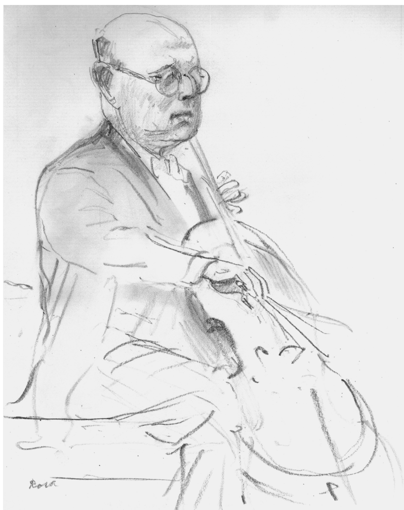
Pablo Casals (1876-1973), violoncellista spagnolo. Professore di violoncello al Conservatorio di Barcellona (1897), raggiunse rapidamente una fama mondiale come concertista. Per protesta contro il franchismo lasciò la Spagna (1938).