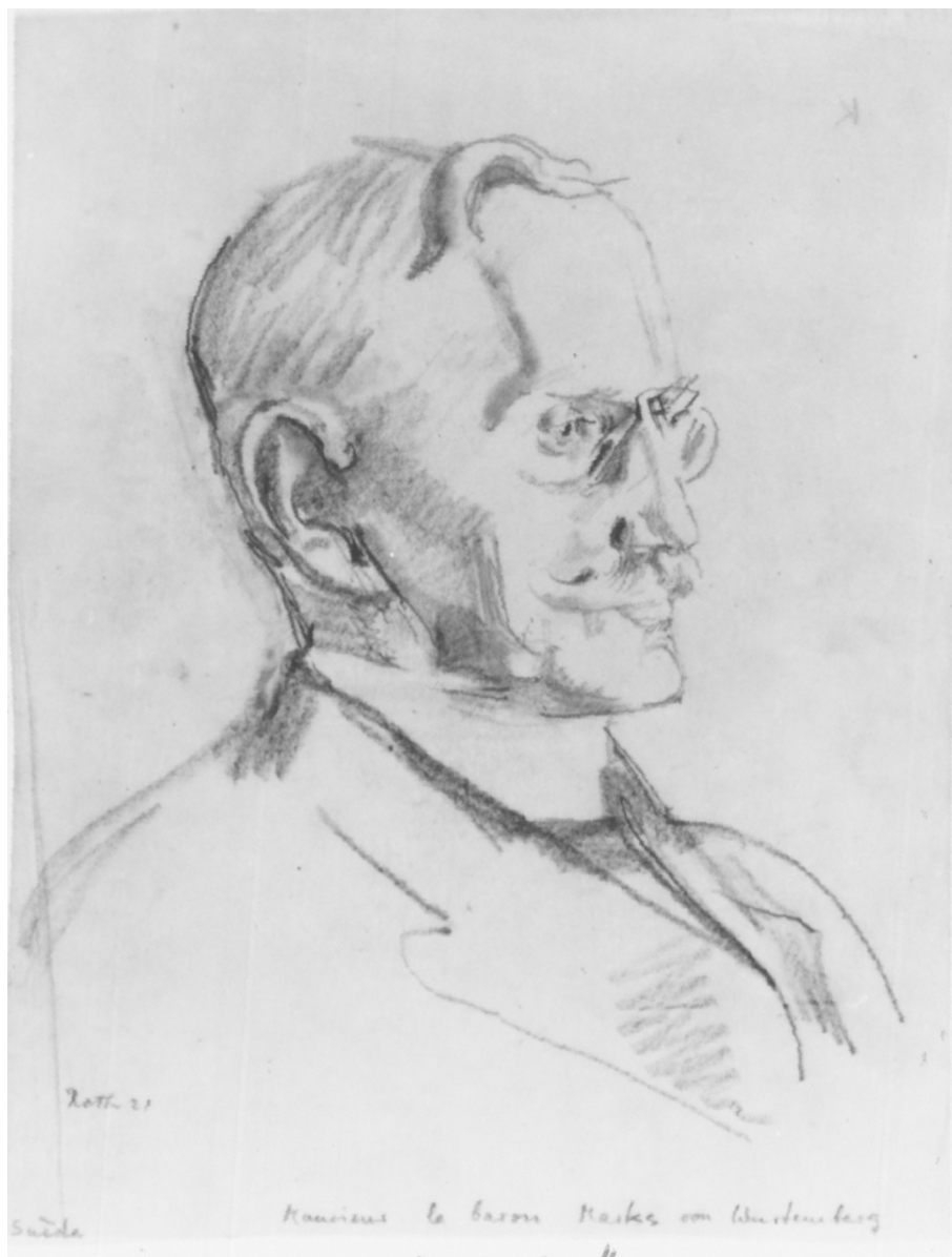
Erik Theodor Marks von Wurtemberg (1861-1937), giurista e politico svedese.

Fu membro della Corte suprema svedese (1903-1920) e ministro degli Affari esteri (1923-1924).