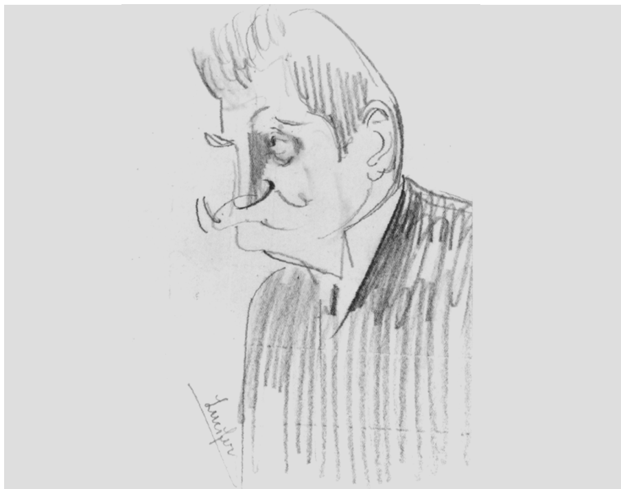
Karl Hjalmar Branting (1860-1925), politico svedese.

Responsabile della politica estera per il giornale radicale «Tiden» (1884) e direttore del quotidiano socialista «Socialdemokraten» (1886), organizzò associazioni operaie e sindacati e fu presidente del partito socialdemocratico dal 1907 fino alla morte. Deputato al Parlamento dal 1896, fu ministro delle Finanze (1917-1919) e rappresentante svedese alla Conferenza della pace (1919).