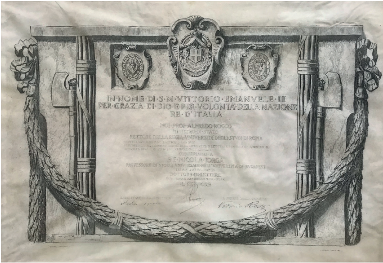
Foto 6. Diploma della Laurea Honoris Causa conferita a Nicolae Iorga dall'Università degli Studi di Roma.