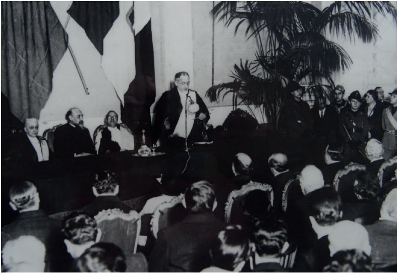
Foto 7. Cerimonia di conferimento del titolo di Doctor honoris causa , Roma 1933.