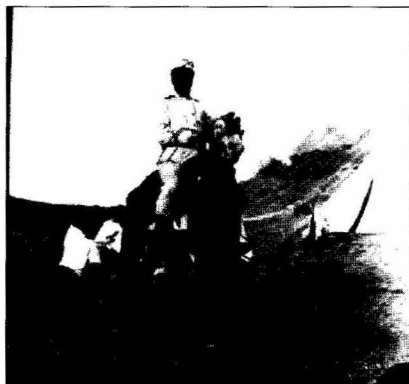
FIGURA 2 - Federico Guarducci (1897)