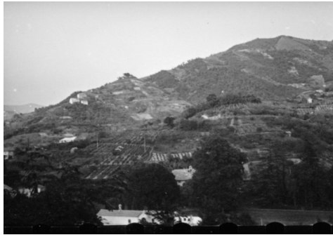
Fig. 4 – Emilio Sereni, località Villa Negrotto-Cambiaso , Serra Riccò (Genova), 21 settembre 1951.

3.4 - Villa Negrotto-Cambiaso – Lungo il torrente Secca Sereni fotografa uno scorcio interessante di ciò che resta del paesaggio agrario gravitante attorno a Villa Negrotto-Cambiaso (coord.: 44° 29' 40" N, 8° 55' 21" E): notevole esempio di villa rustica genovese databile alla metà del sec. XVII, in abbandono dal 1945 (De Negri et. al., 1967, pp. 329-331). Il corpo principale della dimora signorile, seminascondo nell'immagine da un folto di alti alberi, è preceduto da un edificio ad un solo piano comprendente in origine cappella e scuderie. La foto, che ci è pervenuta nel solo formato negativo (fig. 4), può essere confrontata con una simile che Paolo Monti (1908-1982) realizza nel 1964 12 .