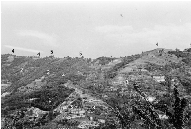
Fig. 3 – Emilio Sereni, località Costa Maigian , Comune di Serra Riccò (Genova), 21 settembre 1951.

Fonte: Archivio-Biblioteca Emilio Sereni, Illustrazioni storia agraria , b. 17, fasc. Paesaggio agricolo ligure e il marrelo , sotto-busta 4, Ronchi a «marrelo» in Val Polcevera Sett. 1951 , n. 12, Ronchi a «marrelo» in Val Polcevera .