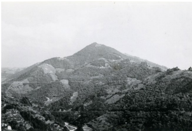
Fig. 2 – Emilio Sereni, località Il Pizzo , Comune di Serra Riccò (Genova), 21 settembre 1951.

3.2 - Il Pizzo – L'immagine (fig. 2), già oggetto di una prima analisi diacronica attraverso l'impiego della fotografia ripetuta e il confronto con la cartografia storica in ambiente GIS (Gabellieri, Gemignani, 2019) raffigura un versante montuoso costellato da ampie radure nel bosco, parte di un rilievo identificato nella attuale cartografia regionale come Il Pizzo (618 m slm; coord.: 44° 30' 33" N, 8° 57' 36" E). Si possono oggi dettagliare alcune dinamiche paesaggistiche alla scala del versante e suggerire ulteriori diverse interpretazioni rispetto a quelle di Sereni. In particolare, con questo esercizio di rapida lettura diacronica della copertura vegetale in senso regressivo, proviamo a ricostruire le dinamiche che l'hanno attraversata a intervalli brevi e a qualificare l'ecologia delle risorse ambientali e l'economia delle produzioni locali alla scala topografica. I temi introdotti, comuni ai casi studio successivi, sono le dinamiche della «rinaturalizzazione», la castanicoltura, i sistemi del pascolo alberato e della transumanza ovina, l'agricoltura di villa.