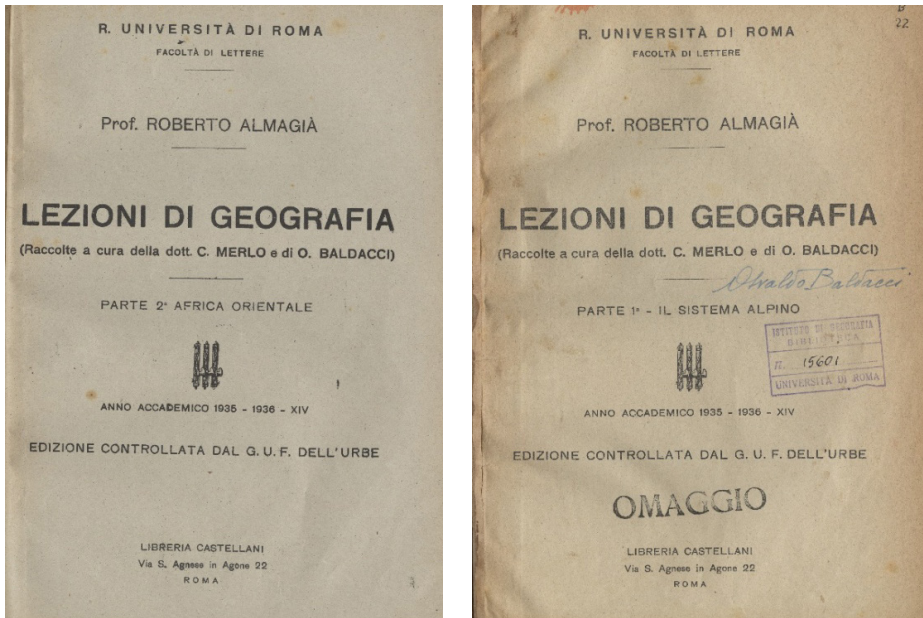
Fig. 2 – Frontespizi delle Lezioni di Geografia di Roberto Almagià curate da Claudia Merlo e Osvaldo Baldacci.