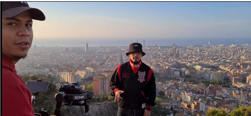
"Los Bunkers", Barcelona. Integrantes: Leo Key Vision & Mr. Tato (Zaragoza) (Marzo, 2021)