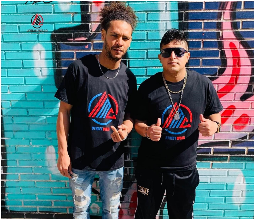
Integrantes: Flako Necio & Coplatino. Hospitalet de Llobregat (Mayo 2021)