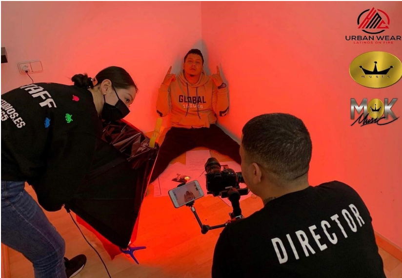
Maragall, una habitación, primer día de grabación. Integrante: Bubuccan, Josselyn & Leo Key Vision (LJ Studios) (Marzo 2021)