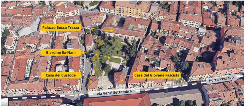
Figura 2: Individuazione di Palazzo Bocca Trezza e degli spazi di pertinenza (elaborazione di Stefania Marini sulla foto aerea di Google Maps, giugno 2024).