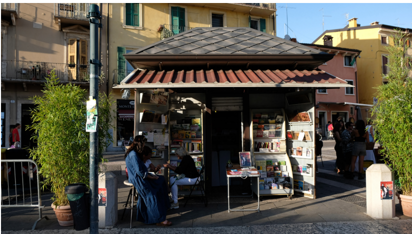
Figura 4: Edicola sociale durante l'evento Festival Veronetta, settembre 2023.