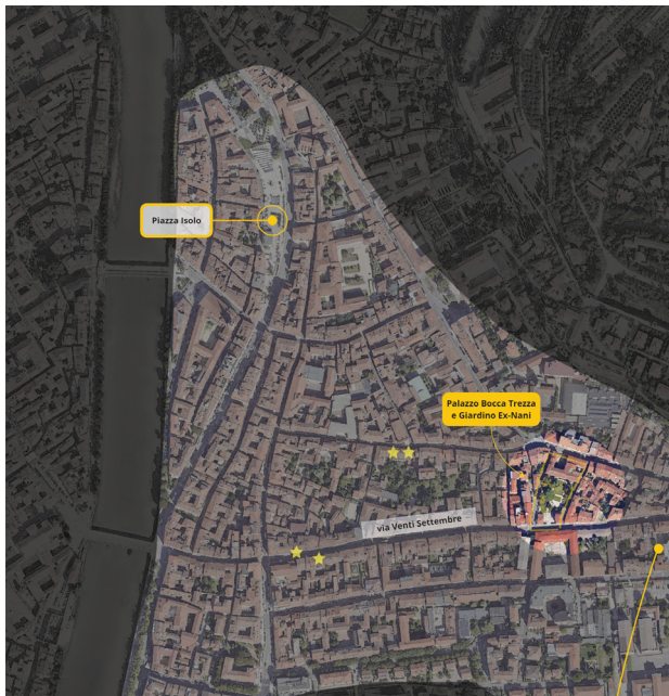
Figura 1: Quartiere Veronetta – così come percepito dalla cittadinanza – e individuazione degli spazi di influenza dell’associazione D-Hub (elaborazione di Stefania Marini sull’ortofoto di Google Satellite, giugno 2024).

Spazi, luoghi e traiettorie disegnano complessivamente un territorio relazionale, uno scenario di rilevante importanza per i processi e gli apprendimenti che prendono vita, testimoniando i processi di cambiamento nel quartiere, accompagnandoli ma anche mediandoli, soprattutto laddove troppo rivolti a prediligere la privatizzazione e a sottrarre spazi comuni e processi autentici di cittadinanza spontanea e collettiva.