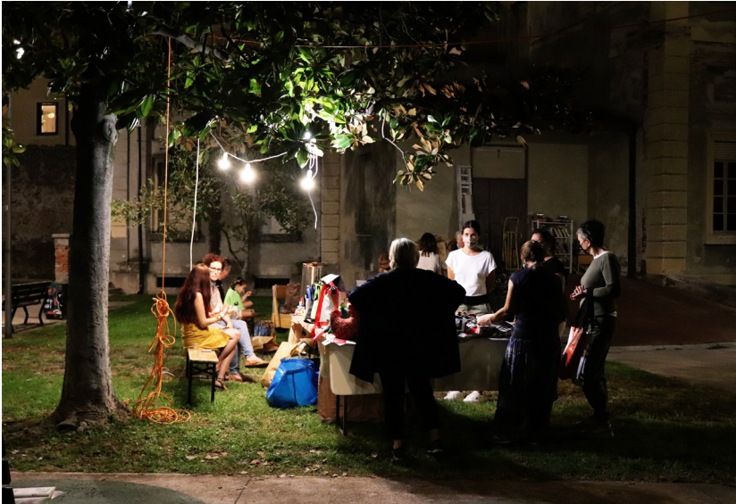
Figura 3: Attività serale nel Giardino Ex-Nani, settembre 2020.

propria pratica. Ciò permette di costruire significati condivisi, rispetto al dialogo con le istituzioni, al valore della cittadinanza attiva e all'importanza della ricerca, necessari a riconoscere l'associazione D-Hub nonché le singole persone che possono darsi una rinnovata identità, trasformandosi da portatrici di bisogni a parte attiva del cambiamento.